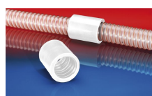
CONNECT 246 FOOD