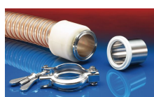
CONNECT TRI-CLAMP FITTING 245