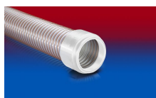
CONNECT 245 FOOD