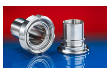
CONNECT ASEPTIC FITTING 249