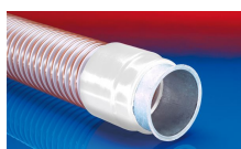
CONNECT 243 FOOD

Při přetlaku a podtlaku doporučujeme dodržet hranici provozní hodnoty. Bližší informace o vyšším zatížení jsou dostupné na vyžádání. Poloměr ohybu je měřen podle vnitřního zahnutí hadice. Právo učinit technické změny je vyhrazeno. Všechny hodnoty jsou stanoveny při teplotě 20 °C a jsou jen přibližné. Další technické údaje jsou dostupné na www.norres.com/cz/technologie/ .