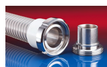
CONNECT MOULD ASSEMBLY 233