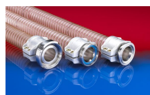
CONNECT SAFETY CLAMP ASSEMBLY 231