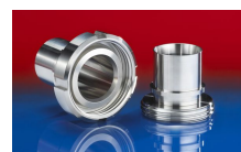
CONNECT DAIRY FITTING 247