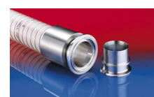
CONNECT PRESS ASSEMBLY 232