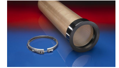
CONNECT 245 VAC- TRUCK