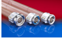
CONNECT SAFETY CLAMP ASSEMBLY 231