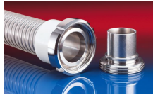
CONNECT MOULD ASSEMBLY 233