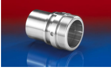
CONNECT THREAD FITTING 234