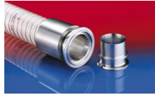
CONNECT PRESS ASSEMBLY 232