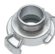
GK 25 AG SS kód 32523