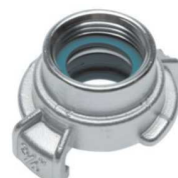
GK 25 IG SS kód 32522