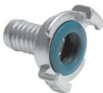
GK 25 TRN SS kód 32521

Poznámka: K upínání doporučujeme spony ASFA nebo GBS.