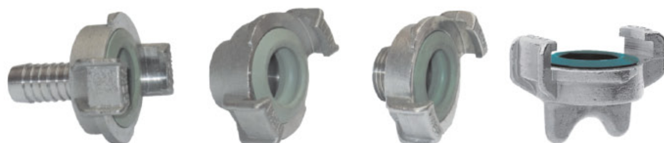
GEKA PLUS SS TRN kód 30186

Poznámka: K upínání doporučujeme spony ASFA nebo GBS. Pro použití na pitnou vodu doporučujeme GEKA PLUS KTW.