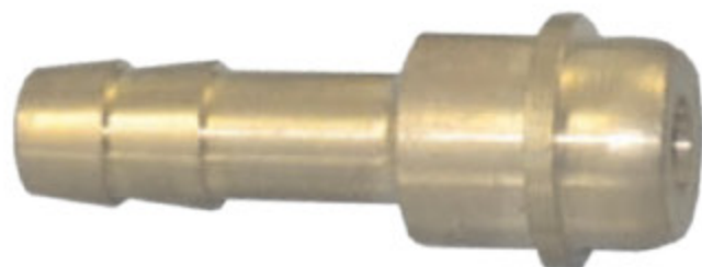
PNEUMATIK IG hadicový trn pro „PNEUMATIK MATKA“ kód 30335