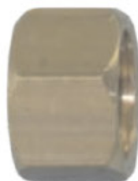
PNEUMATIK MATKA převlečná matka pro trn PNEUMATIK IG kód 30336