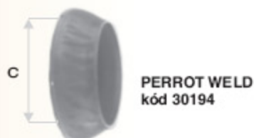
PERROT WELD kód 30194