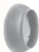
PERROT ZÁSLEPKA kód 30196

• Materiál: Uhlíková ocel, žárově zinkována