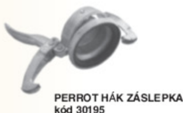
PERROT HÁK ZÁSLEPKA kód 30195