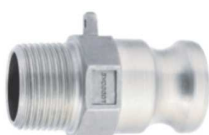
KAMLOK SNOW F SS Trn rychlospojky s vnějším závitem kód 30533