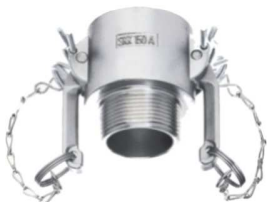
KAMLOK SNOW SKK A-R Rychlospojka vnějším závitem kód 30530