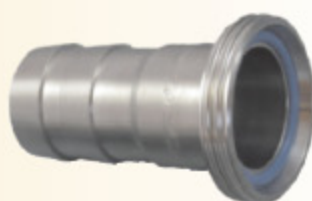
DRINTEX AG kód 30341