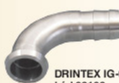
DRINTEX IG-90 kód 32132