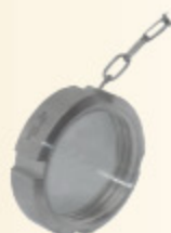
DRINTEX CAP MB kód 30346