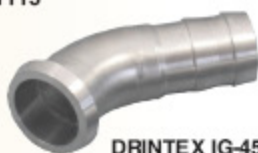
DRINTEX IG-45 kód 32133