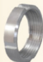
DRINTEX MATKA kód 30345