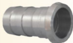
DRINTEX IG kód 30343