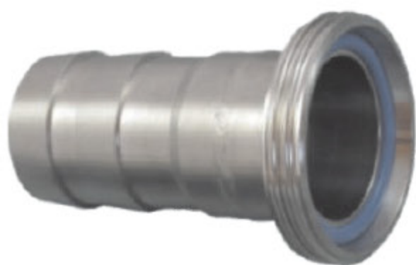
DRINTEX AG hadicový trn s vnějším závitem kód 30341