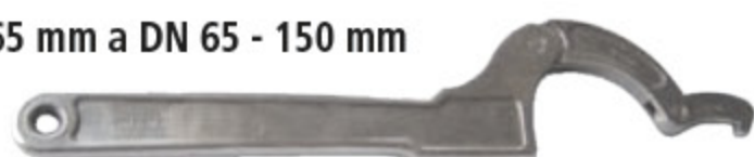
Klíč DRINTEX Montážní klíč pro DN 20 - 65 mm a DN 65 - 150 mm kód 31115