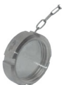
DRINTEX CAP MB zaslepovací závit s úchytem kód 30346