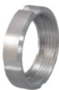
DRINTEX MATKA matice pro DRINTEX IG kód 30345