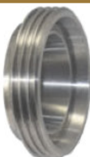
DRINTEX CAP VB záslepka s vnějším závitem kód 59315