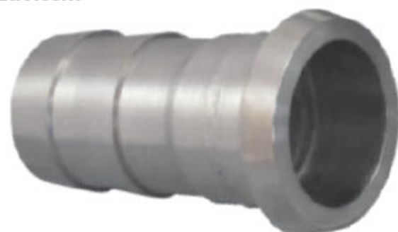
DRINTEX IG hadicový trn pro matku s vnitřním závitem kód 30343