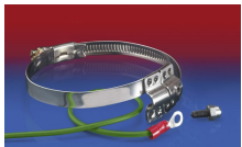
CLAMP 212 EC